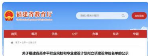
2020年为建设性职业院校