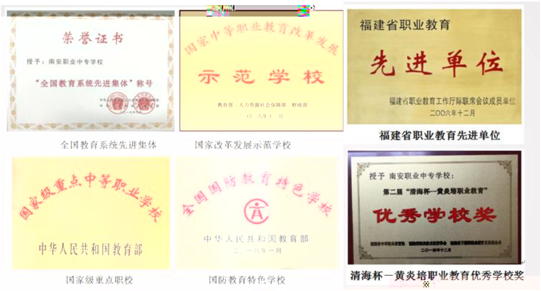
全国教育系统先进集体